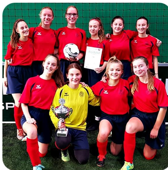
Mädchen-Fußballmannschaft, 1. Platz

Auf unserer Homepage findest du viele weitere Informationen über unsere Schule: www.kippenberg-gymnasium.de