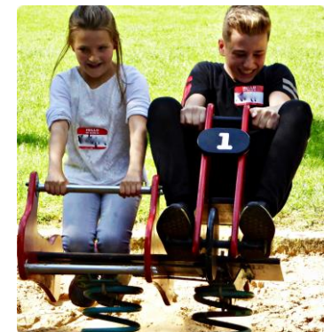
Patenausflug Klasse 5 und Klasse 9

In Klasse 6 kannst du zwischen Latein und Französisch wählen. Ab Klasse 8 bieten wir in unserem Wahlpflichtbereich zusätzlich Spanisch als Wahlpflichtfach an.