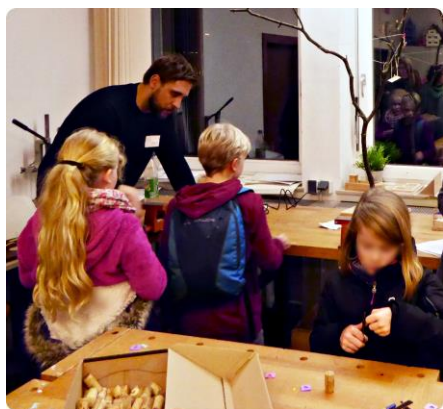
Werken am Schnuppertag

Unser breites Angebot an Arbeitsgemeinschaften: Schach-AG, Online-Schülerzeitung, Homepage-, Tischtennis- und Fußball-AG, „Jugend forscht“, „Jugend debattiert“, Orchester und Chöre, Jazz-, Rock- und Perkussion-AG. Du kannst bei uns ab Klasse 7 auch Schulsanitäter werden.