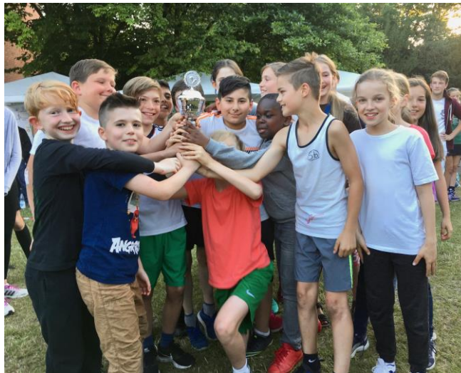
Siegerteam nach dem „Kippe-Cup“