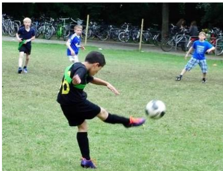
„Kippe-Cup“ Endspiel Klasse 5

Du kannst bei uns ab Klasse 7 auch Schulsanitäter werden.